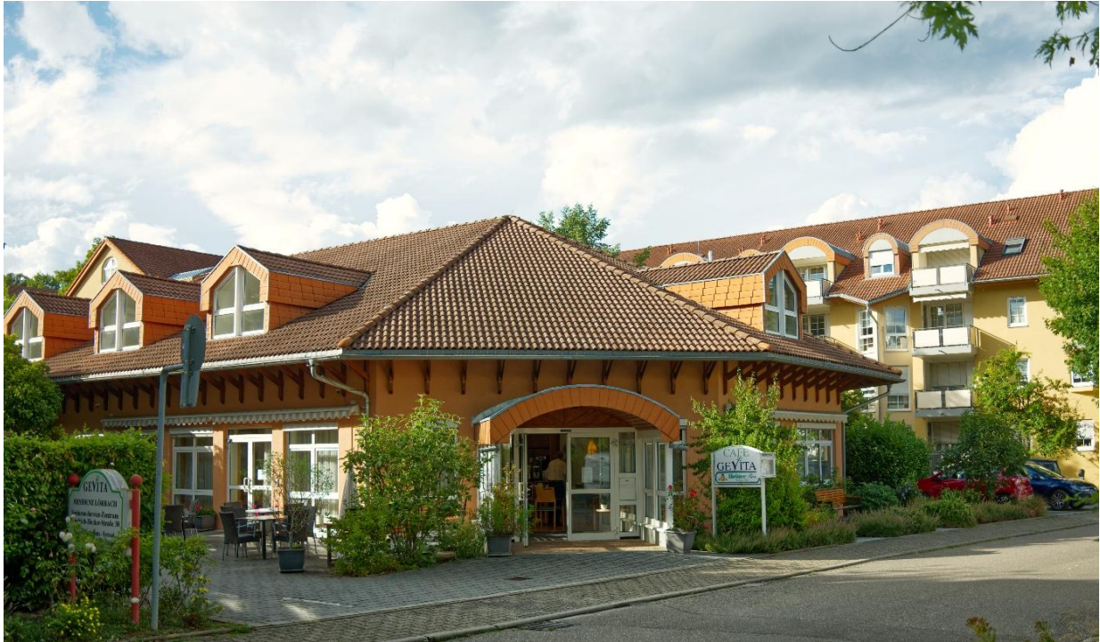
Gevita Residenz – zorgcampus in Lörrach (DE)

Aedifica investeert ca. 20 miljoen € in de acquisitie van een volledig operationele zorgcampus in Lörrach (Duitsland).