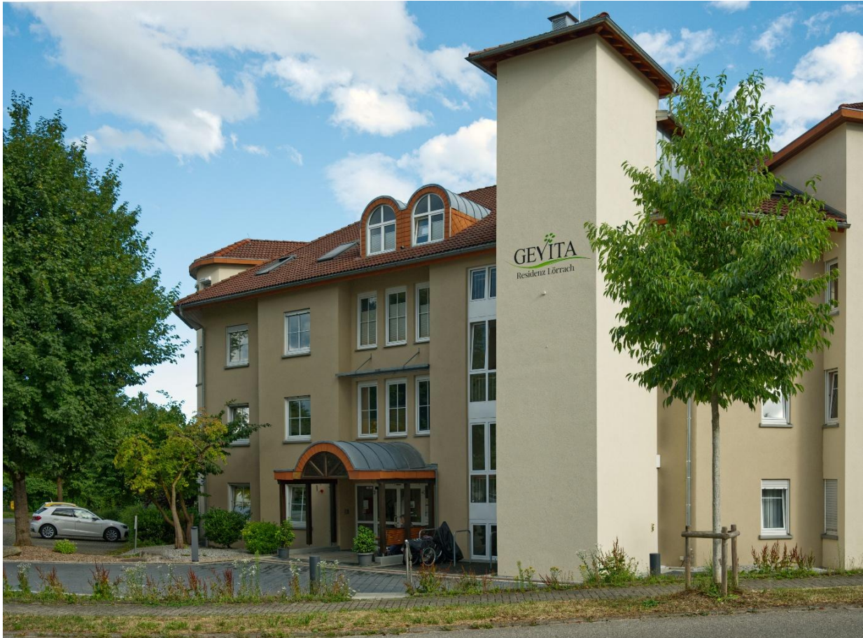
Gevita Residenz – zorgcampus in Lörrach (DE)

29 juni 2026 – voor opening van de markten