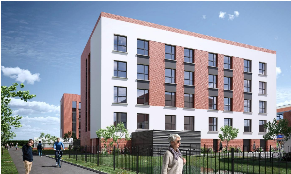
Dublin Crumlin – maison de repos à construire à Dublin

Le 5 janvier 2026 – après clôture des marchés