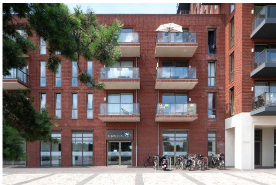
Centre médical à De Kroon campus de soins

Le 5 janvier 2026 – après clôture des marchés