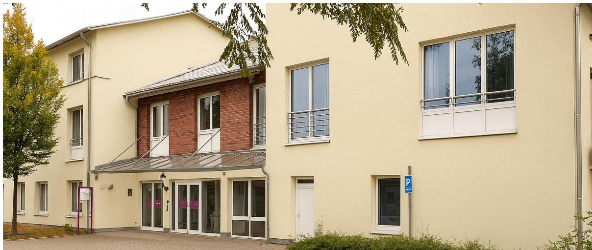
Harbourg – maison de repos à Hambourg (DE)

Aedifica a investi environ 10 millions € dans l'acquisition d'une maison de repos en exploitation à Hambourg (Allemagne).