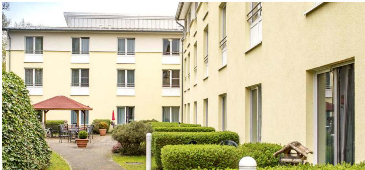
Seniorenheim an der Alten Saline – maison de repos à Lunebourg (DE)

Aedifica a investi environ 10,5 millions € dans l'acquisition d'une maison de repos en exploitation à Lunebourg (Allemagne).