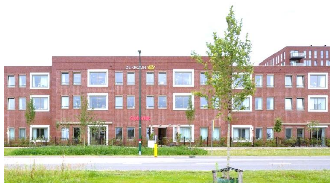
Maison de repos à De Kroon campus de soins