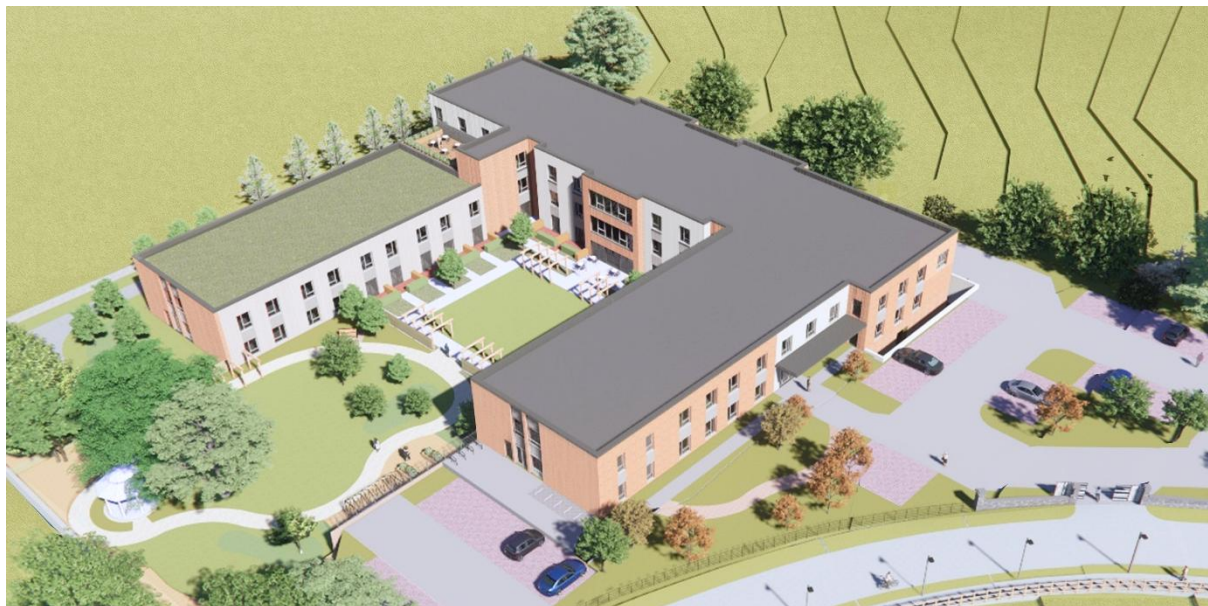
Kilcoole (illustration) – maison de repos à construire à Kilcoole

Aedifica investira environ 25 millions € dans le développement d'une maison de repos haut de gamme et spécialement conçue à cet effet à Kilcoole (Région métropolitaine de Dublin, Irlande).