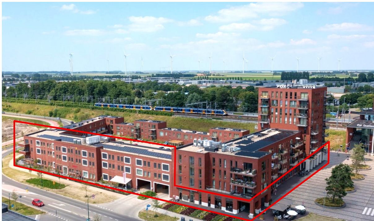
De Kroon –campus de soins à Dronten (NL)

Aedifica a investi environ 12,5 millions € dans l'acquisition d'un campus de soins en exploitation à Dronten (Pays-Bas).