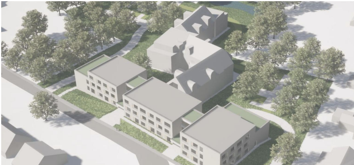
Coham (illustration) – maison de repos à agrandir et à rénover à Tessenderlo-Ham

Aedifica investira environ 16,5 millions € dans l'extension et la rénovation d'une maison de repos en exploitation à Tessenderlo-Ham (Belgique).