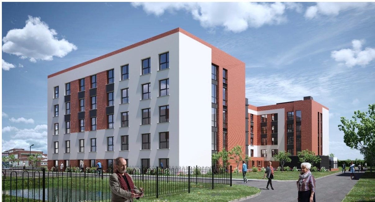
Crumlin (illustration) – maison de repos à construire à Dublin

Aedifica investira environ 34 millions € dans le développement d'une maison de repos haut de gamme spécialement conçue à cet effet à Dublin (Irlande).