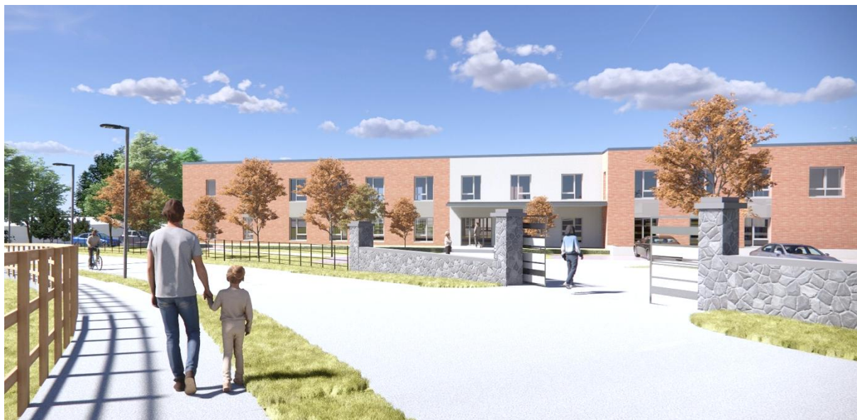
Kilcoole (illustration) – Maison de repos à construire à Kilcoole

Le 5 janvier 2026 – après clôture des marchés