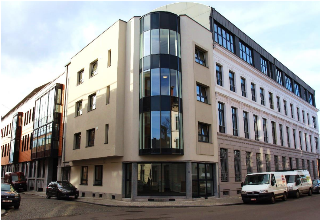
Franki – Luik

Aedifica investeert ca. 29 miljoen € in de acquisitie van een volledig operationeel woonzorgcentrum in België.