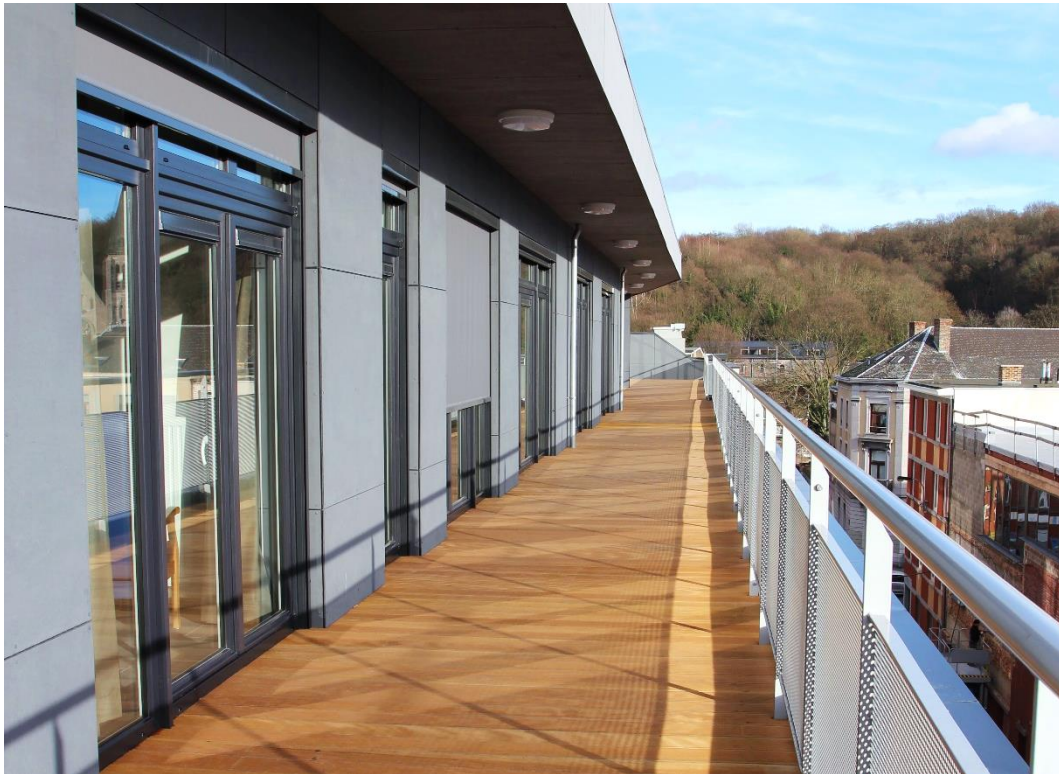
Franki – Luik

19 december 2024 – na sluiting van de markten