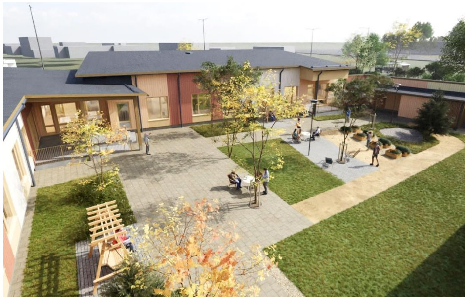
Vantaa Haravakuja (impressie) – Vantaa

Aedifica heeft twee nieuwe projecten voor een totaalbedrag van ca. 8 miljoen € toegevoegd aan haar investeringsprogramma in Finland. Beide projecten zijn in-house ontworpen en ontwikkeld door ons lokale Hoivatilat-team.