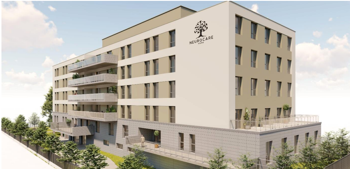
Zamora Av. de Valladolid (illustration) – Zamora

Aedifica investira environ 13 millions € dans la construction d'une maison de repos à Zamora (ES).