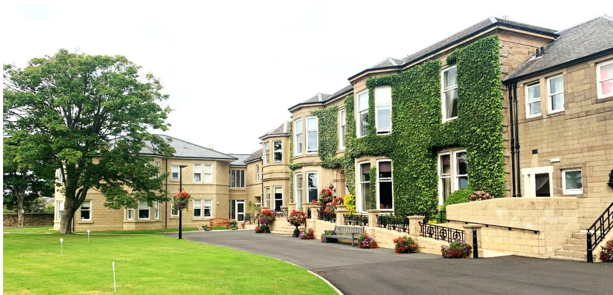
Creggan Bahn Court – Ayr

Aedifica investeert ca. 8,5 miljoen £ in de acquisitie van een woonzorgcentrum dat reeds in exploitatie is in Ayr (UK).