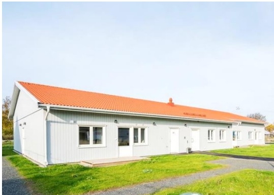
Nyby 3:68 – Laholm

Le 24 juin 2021 – après clôture des marchés