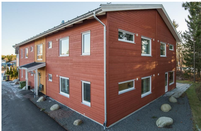
Bälinge Lövsta 10:140 – Uppsala

Le 24 juin 2021 – après clôture des marchés