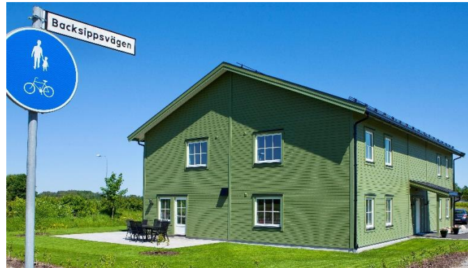
Bälinge Lövsta 9:19 – Uppsala

3 établissements de soins à Uppsala sont exploités par Frösunda Omsorg , un acteur privé bénéficiant de plus de 30 ans d'expérience dans le secteur des soins de santé suédois. Le groupe fournit des soins aux personnes âgées, des soins aux personnes handicapées et des services d'assistance personnelle à plus de 2.100 personnes, en exploitant plus de 100 établissements de soins.