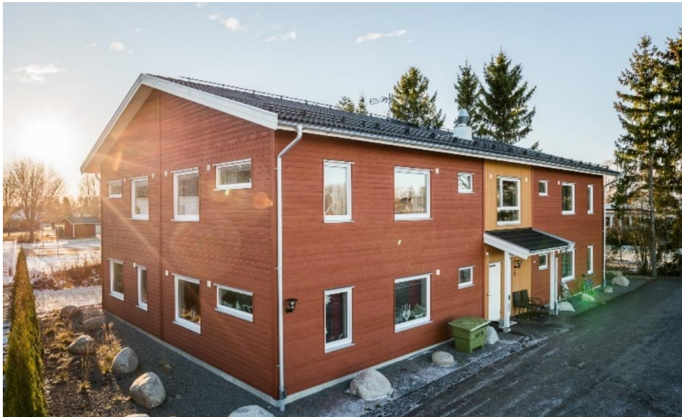
Bälinge Lövsta 10:140 – Uppsala

Le 24 juin 2021 – après clôture des marchés