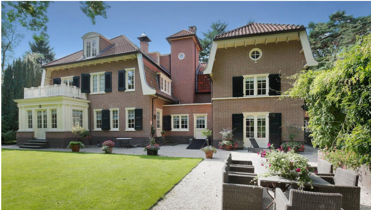
Villa Walgaerde – Hilversum

Aedifica meldt de acquisitie van een site van huisvesting voor senioren in Nederland, zoals aangekondigd in het persbericht van 1 maart 2016.