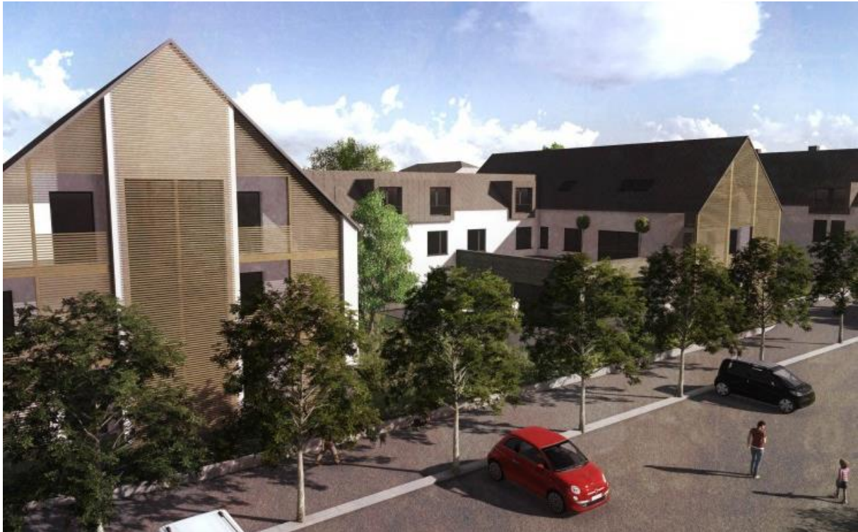
La Ferme Blanche na verbouwings- en uitbreidingswerken (tekening) 9 – Remicourt

Aedifica meldt de terbeschikkingstelling van woonzorgcentrum La Ferme Blanche 8 in Remicourt (provincie Luik, België) na de verbouwings- en uitbreidingswerken.