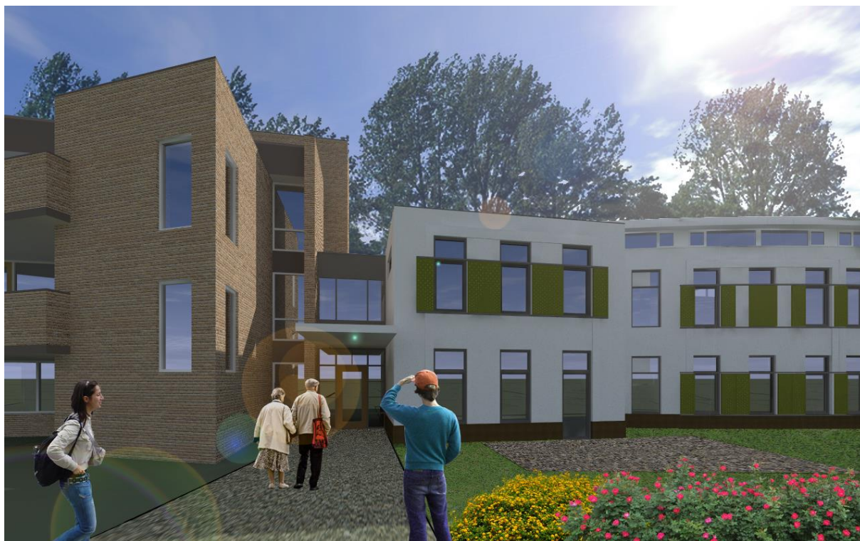
Martha Flora Hilversum (tekening) 3 – Hilversum

31 maart 2017 – na sluiting van de markten Onder embargo tot 17u40