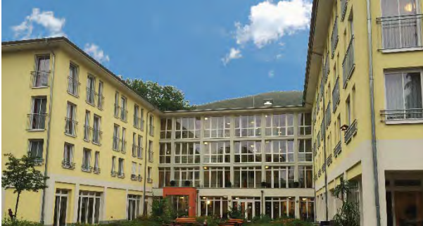
Seniorenresidenz Am Stübchenbach

16. Dezember 2014 – nach Schliessung der Märkte Unter Verschluss bis 17Uhr40