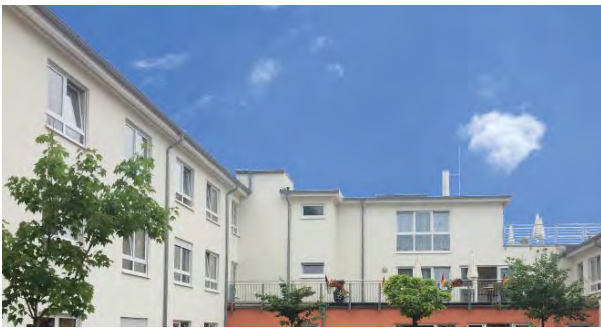
Die Rose im Kalletal