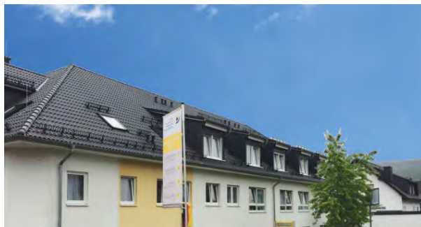
Senioreneinrichtung Haus Matthäus