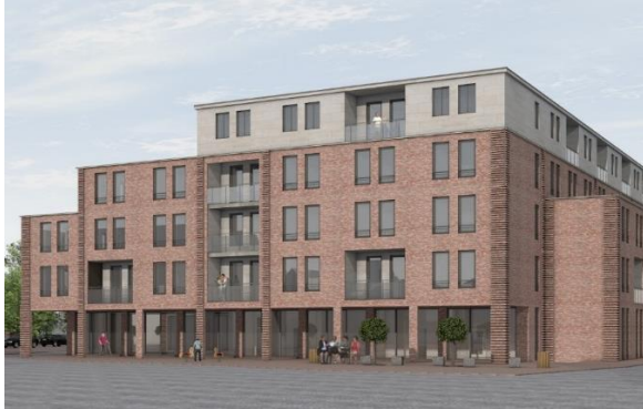
Quartier am Rathausmarkt – Bremervörde