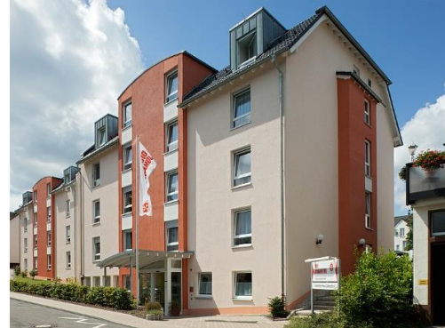
Johanniter-Haus Lüdenscheid – Lüdenscheid