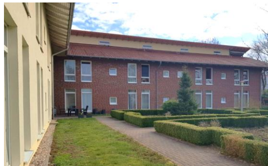
Sonnenhaus Ramsloh – Ramsloh