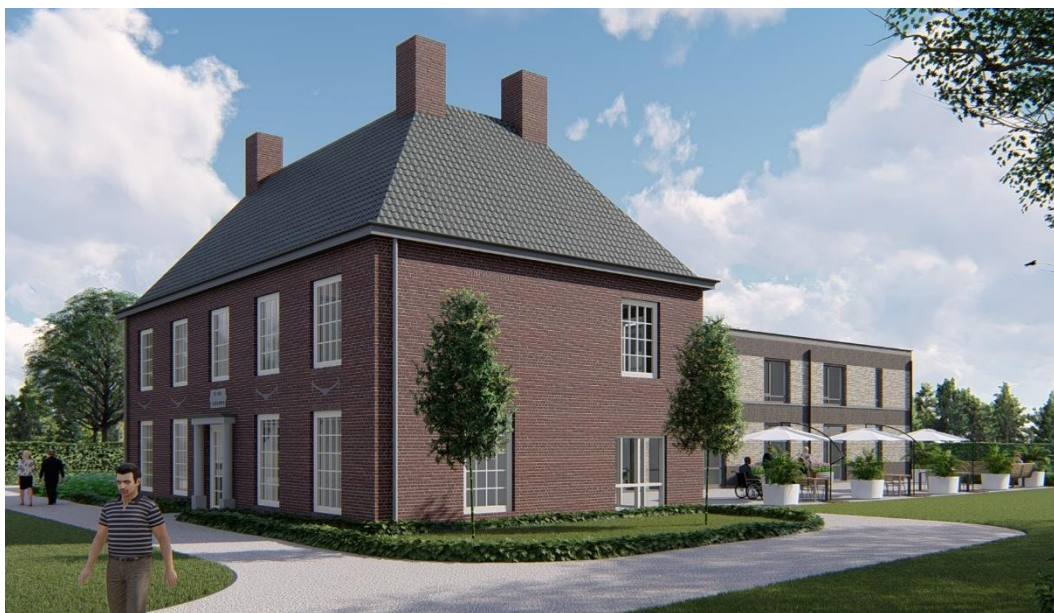
Sorghuys Tilburg (tekening) – Berkel-Enschot

Op 20 februari 2020 vond de oplevering plaats van zorgresidentie Sorghuys Tilburg 4 in Berkel-Enschot, een deelgemeente van Tilburg (214.000 inwoners, provincie Noord-Brabant). Deze woonzorglocatie voor senioren met hoge zorgbehoeften biedt plaats aan 22 bewoners en wordt geëxploiteerd door Senior Living (deel van de Korian-groep).