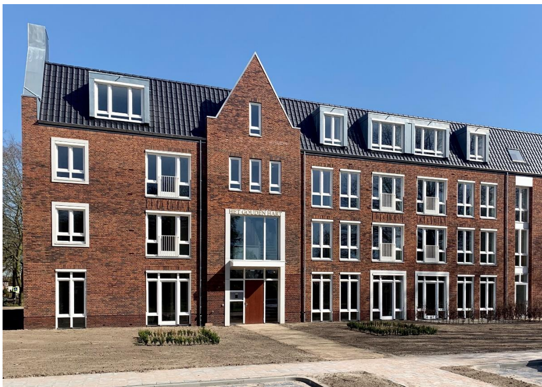
Het Gouden Hart Harderwijk – Harderwijk

Op 31 maart 2020 vond de oplevering plaats van zorgvastgoedsite Het Gouden Hart Harderwijk 3 , gelegen in een groene residentiële wijk nabij het centrum van Harderwijk (47.000 inwoners, provincie Gelderland). Deze woonzorglocatie biedt plaats aan 45 bewoners: 25 senioren met hoge zorgbehoeften en 20 senioren die zelfstandig willen wonen met zorg en diensten op aanvraag. Het gebouw wordt geëxploiteerd door Het Gouden Hart (deel van de Korian-groep).